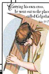
Carrying his own cross, he went out to the place called Golgotha. Lk. 23:27